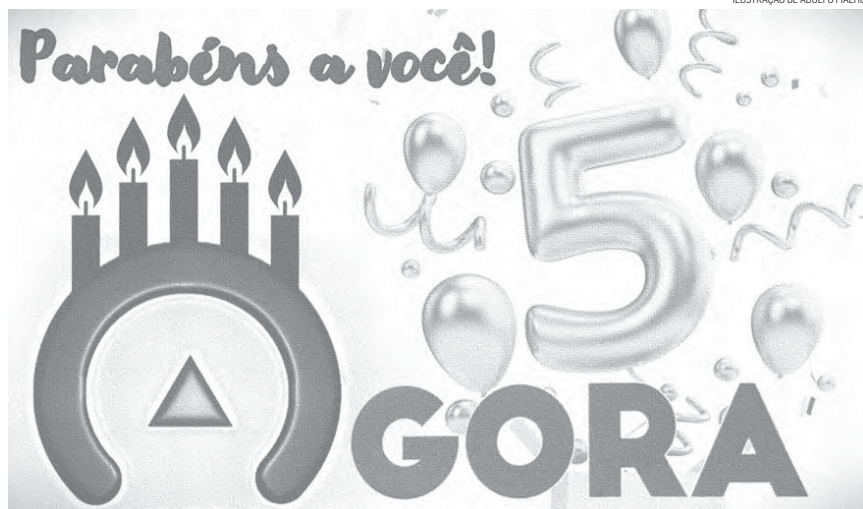
ILUSTRAÇÃO DE ADOLFO FIALHO

"Parabéns a nós, por mais um ano juntos!"