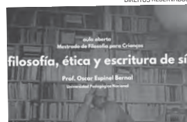
Aula aberta marca o arranque do Mestrado em Filosofia para Crianças