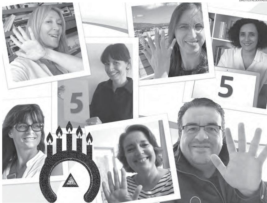
A aventura dos cinco...

Olhando para estes cinco anos, vejo, antes de mais, persistência. Concluído o primeiro ano, podíamos ter fechado a casa. Mas não o fizemos. Acreditamos numa universidade fora de portas: na cidade, na ilha, nos Açores, e por onde cada um(a) de nós (docentes, estudantes, funcionários) estiver. É por isso que continuamos levando até si o que de melhor sabemos e fazemos na FCSH. Tem sido uma