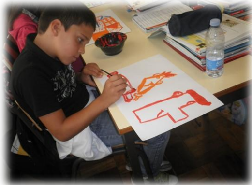
Imagem nº 9 – Criança a pintar ao som da música