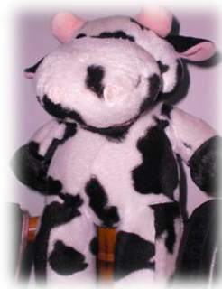
Imagem nº 12 – Fantoche da Vaca Cornélia

Este recurso não constou da planificação da 3ª e última intervenção mas foi uma estratégia de organizar e manipular o comportamento dos alunos em sala de aula.