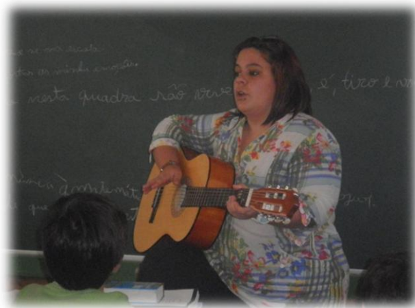
Imagem nº 11 – Aprendizagem da canção “Aprender com a música”

Esta atividade foi realizada no dia 26 de novembro de 2012 (3ª intervenção no âmbito do Ensino do 1º Ciclo do Ensino Básico), no segundo período da manhã, das 11h às 12h20. Em primeiro lugar, apresentamos a planificação correspondente a esta mesma atividade.