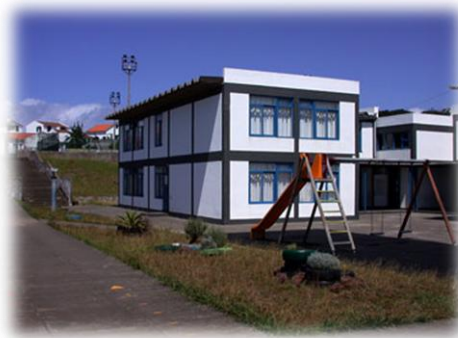
Imagem nº 1 - Escola EB1/JI São Roque