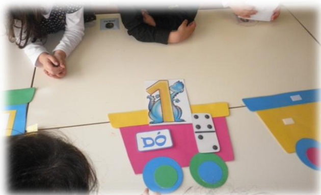
Imagem nº 3 – Comboio da Notas Musicais