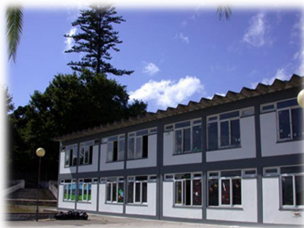
Imagem n° 7 – EB1/JI da Matriz