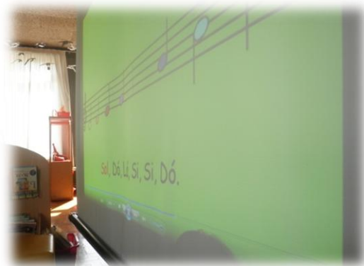
Imagem nº 4 – Vídeo da Canção DÓ RÉ MI

Esta atividade foi realizada no dia 13 de março de 2012 (1ª intervenção no âmbito do ensino Pré-Escolar), no segundo período da manhã, das 11h às 12h e foi finalizada das 13h30 às 15h. De seguida apresentamos, de forma sistematizada, a planificação correspondente a esta mesma atividade.