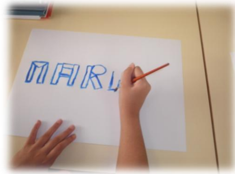
Imagem nº 10 – Pintura realizada ao som da música

Esta atividade foi realizada no dia 5 de novembro de 2012 (2ª intervenção no âmbito do Ensino do 1º Ciclo do Ensino Básico), no período da manhã, das 10h às 10h30. Primeiramente, apresentamos a planificação correspondente a esta mesma atividade.