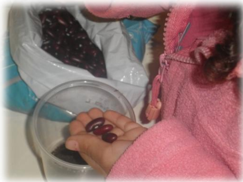
Imagem nº 5 – Plantação do Feijão