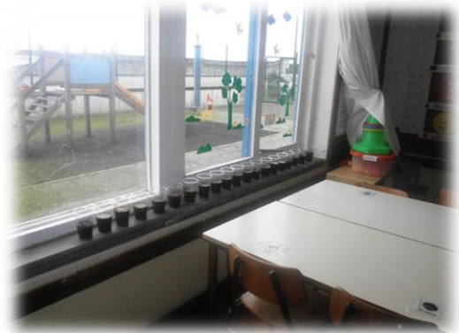
Imagem nº 6 – Crescimento do Feijão

Esta atividade foi realizada no dia 16 de abril de 2012 (2ª intervenção no âmbito do ensino Pré-Escolar), no período da tarde, das 13h30 às 15h. Tal como na atividade anterior, apresentamos a planificação correspondente a esta mesma atividade.