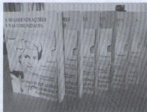
Imagem 1: Os seis volumes de A Mulher nos Açores e nas Comunidades

Da América do Norte, A Vez e a Voz rumou até outros continentes e academias: a Universidade de Macau, em 2007, a Universidade Federal de Curitiba, Brasil, em 2009, e a Université Paris/Ouest Nanterre, França,