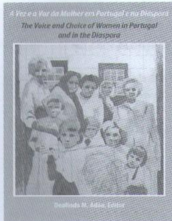
Imagem 4: II Congresso Internacional A Vez e a Voz da Mulher, de 2005