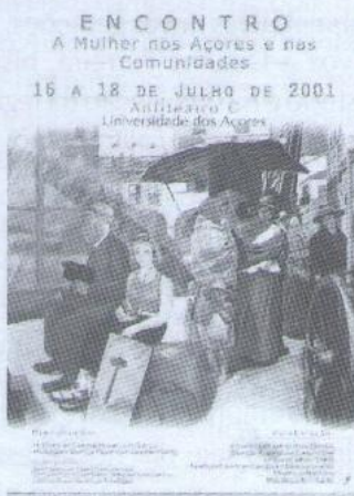
Imagem 2: Encontro A Mulher nos Açores e nas Comunidades, de 2001