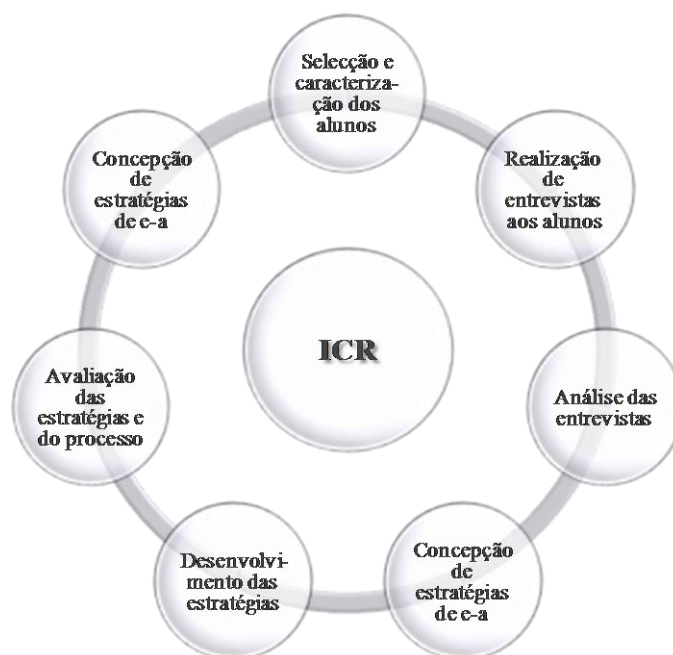
Fig. 2 – Representação do processo de investigação-acção subjacente ao ICR (Leal, Sousa & Dinis, 2009) 4 .

Seguindo uma metodologia de investigação-acção colaborativa, o ICR desenvolve-se em ciclos, correspondendo cada ciclo a um ano lectivo (ver Fig. 2). O processo inicia-se com a selecção dos alunos que, numa ou mais turmas de cada docente, demonstram pouca ou nenhuma motivação para a aprendizagem e um empenhamento e satisfação escolares muito baixos. Os alunos são caracterizados e são-lhes realizadas entrevistas com o objectivo de apreender e compreender as suas representações da escola, das disciplinas, conteúdos e práticas escolares, e de identificar os seus interesses e expectativas de futuro.