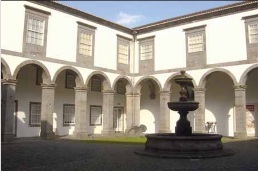
Claustro do Convento de São Francisco, em Angra do Heroísmo, onde durante décadas funcionou o Liceu da cidade

Essa referência específica, na segunda parte do título da última obra do Pe. Jerónimo Emiliano aqui indicada, tem a ver com o facto de entretanto ter sido criado, por um decreto de 20 de Setembro de 1844 – no âmbito da reforma educativa de Costa Cabral - o Liceu de Angra do Heroísmo. Esta instituição passara a funcionar – e assim sucedeu durante