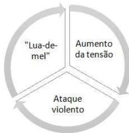
Figura II – Ciclo da violência doméstica.