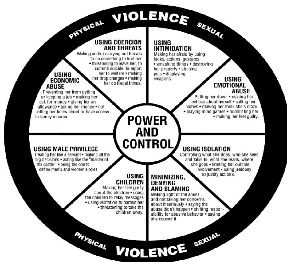
Figura III - "A roda do poder e controle" 20

Intimidação – que consiste em atemorizar a propósito de olhares, comportamentos e atos, partir e destruir objetos pertencentes à vítima, exibir armas; III) Usar a violência emocional – que consiste em desmoralizar, fazer com que a vítima se sinta mal consigo mesma, que se sinta culpada e diminuída, insultar, humilhar; IV) Isolamento – que consiste no controlo da vida da vítima e limitação do envolvimento externo do outro; IV) Minimização, negação e condenação – que consiste em desvalorizar a violência e não atender às preocupações da vítima, negar que houve agressão e violência e responsabilizar a vítima pelo comportamento violento; V) Instrumentalização dos filhos – que consiste em fazer com que a vítima se sinta culpada relativamente aos filhos, usar os filhos para passar uma mensagem, ameaçar que irá levar os filhos de casa; VI) Utilização de “privilégios machistas” – que consiste em tratar a mulher como empregada, assumindo todas as decisões importantes sozinho; VII) Violência económica – que consiste em evitar que o outro tenha a sua independência financeira, forçando assim a que peça dinheiro, havendo assim um certo controlo.