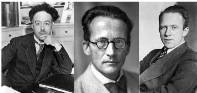
Fig. 1 - Da esquerda, para a direita: De Broglie, Schrödinger e Heisenberg.