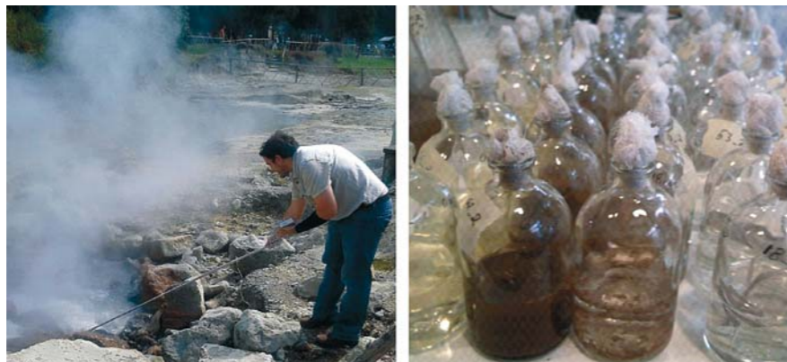
Recolha de amostras nas fumarolas da lagoa das Furnas. As amostras são posteriormente tratadas no laboratório para isolamento das bactérias produtoras de enzimas termoestáveis.

tais. Esta celulase foi purificada por cromatografia líquida, que é uma técnica usada correntemente no GBM-UAc. Depois de pura, a enzima foi caracterizada por electroforese e por espectrometria de massa, concluindo-se que se tratava de uma proteína. A actividade da enzima pura foi testada a diferentes temperaturas, a diferentes pH e na presença de diferentes solventes. Mostrou-se que a enzima era estável, isto é que mantinha sempre a actividade a temperaturas entre 40 e 60°C, a pH entre 5 e 10 e na presença de surfactantes. A bactéria produtora desta enzima foi caracterizada por técnicas moleculares de análise de DNA. A sequência do gene 16S RNA mostrou que este isolado pertence à espécie Bacillus mycoides , embora tenha alguma distância filogenética de isolados de outras colecções públicas, o que provavelmente se explica pelo isolamento geográfico a que os organismos dos Açores estão sujeitos. O facto desta enzima ser activa numa gama relativamente larga de temperaturas e de pH e na presença de surfactantes parece dar-lhe algum potencial biotecnológico.