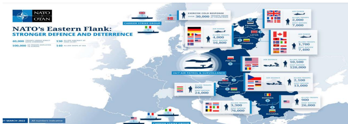
Figura 2- Reforço do posicionamento militar da NATO após a invasão da Ucrânia.

reforço da postura de dissuasão é assegurada mediante três principais elementos: formações de combate robustas; um novo modelo de forças que inclui 100 000 forças para destacamento num período de 10 dias, 200 000 num período de 30 dias e 300 000 entre os 30 a 180 dias; e pre-posicionamento de equipamento e stock de combate 360 . A invasão conduziu, por isto, à revisão da estratégia de tripwire forces , reforçando-a através do estabelecimento de forças semi-permanentes e do aumento de capacidades. 361