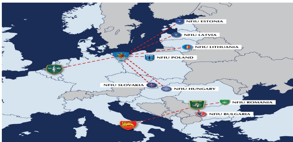
Figura 1- Localização dos NFIU's.

HQ da Multinational Division Southeast na Roménia para comandar as NFIU's de forma flexível. 338