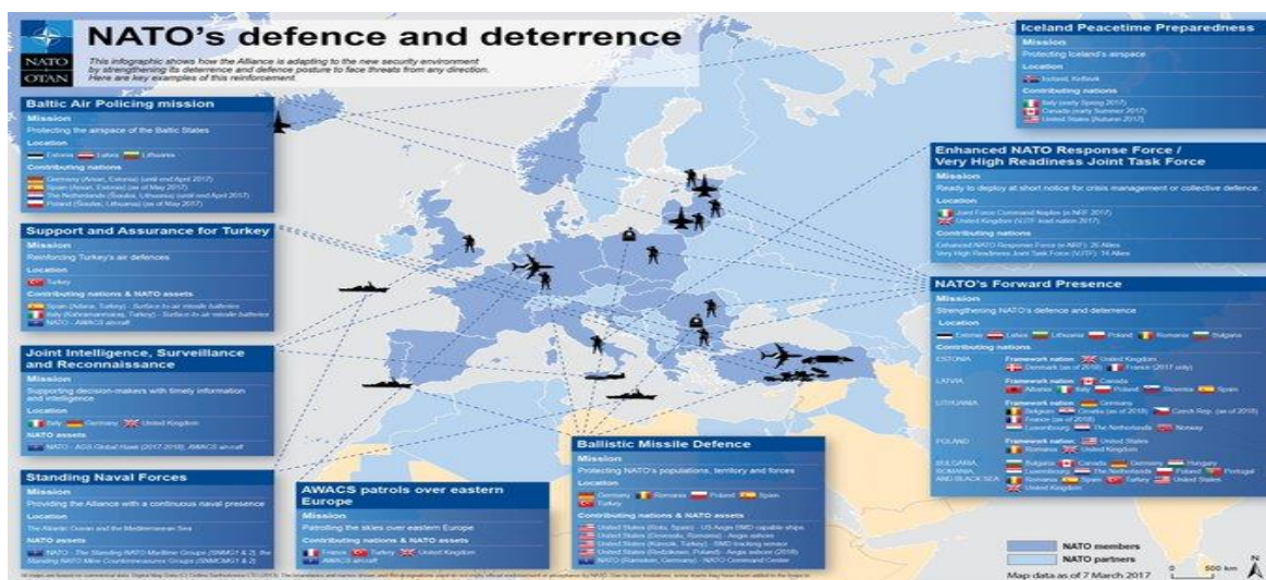
Figura 2- Presença e composição do eFP e tFP.

Em complementaridade com as decisões militares da NATO, a dissuasão russa é reforçada com a política norte-americana designada de European Reassurance Initiative , mais tarde European Deterrence Initiative caracterizada pelo reforço da presença militar norte-americana, sustentada pela persistente rotatividade de forças na Polónia e nos Bálticos e pelo aumento dos exercícios militares 347 .