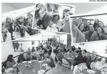
Natal solidário na UAc