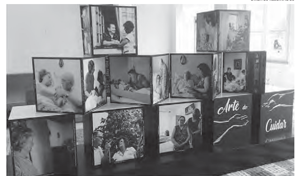
Exposição “Arte do Cuidar” na FCSH