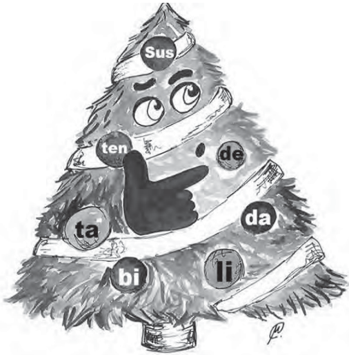
ILUSTRAÇÃO DE CARLA MEDEIROS (ANTIGA ALUNA DO MESTRADO EM PRÉ-PROF DA FCSH)