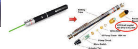
Fig. 4 - Geração de segundo harmónico. Adaptado de https://www.osti.gov/servlets/purl/1510171

Uma característica comum aos materiais que duplicam a frequência da luz é a de não serem centrosimétricos, ou seja, não possuírem centro de simetria, caso contrário o termo o termo não-linear de segunda ordem não estará presente. O fosfato de titânio de potássio (KTIPO 3 ou KTP) é um material óptico não-linear usado em muitas aplicações, como por exemplo no fabrico de ponteiros laser, aqueles pequenos dispositivos portáteis que dão tanto jeito a quem dá aulas (Fig.4).