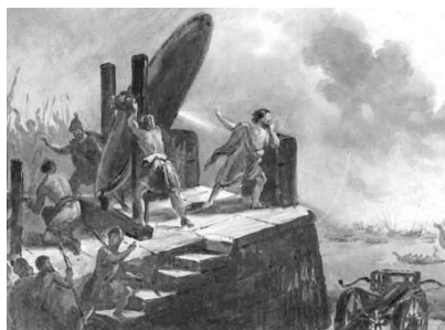
Fig.1 - O cerco de Siracusa (215 a.C.).

A Eq.2 não só inclui o termo linear como também outros, termos quadráticos χ (2) , cúbicos χ (3) , etc. À passagem de uma onda de luz de frequência ω, o termo quadrático faz com que o material gere uma frequência 2ω, ou seja, gera o SHG da onda incidente.