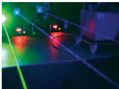
Fig.2 - Diodos Lasers no Laboratório de espectroscopia ótica da Universidade de La Laguna (ULL).

A primeira experiência de SHG foi realizada por Franken et al., em 1961, tendo-se observado que ao incidir um laser de rubi (λ=694 nm) num cristal de quartzo, foi emitida radiação ultravioleta de λ=347 nm (o 2º harmónico do laser).