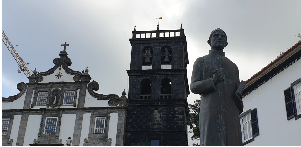
Fig. 1 - Estátua de Gaspar Frutuoso com a Igreja Matriz de Nossa Senhora da Estrela da cidade da Ribeira Grande, S. Miguel, Açores em pano de fundo. No ano de 1565, Gaspar Frutuoso foi nomeado vigário desta igreja Matriz, cargo que exerceu durante 26 anos, até à data da sua morte. Foto de Élia de Sousa, 2020.

idênticos da sua fauna e flora, bem como a sua origem vulcânica, partilha ainda um conjunto de laços históricos e culturais com mais de quinhentos anos de memórias.