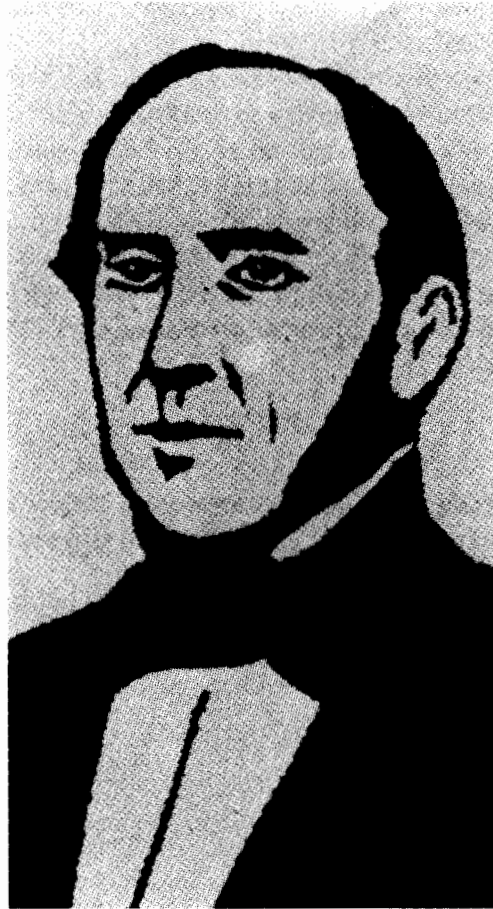
Retrato de Francisco Manoel Raposo d' Almeida (constante da 1ª edição de “O Camões”, 1851).