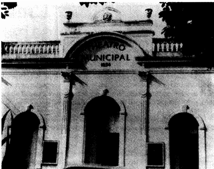
Fachada do Teatro Municipal de São José, SC, onde foi apresentada a peça “O Monge da Serra d’ Ossa”, de autoria de Raposo d’ Almeida.

Representado na inauguração do teatro da cidade de S. José, SC, a 21 de Junho de 1856, quando Raposo d’ Almeida ainda não se encontra em SC.