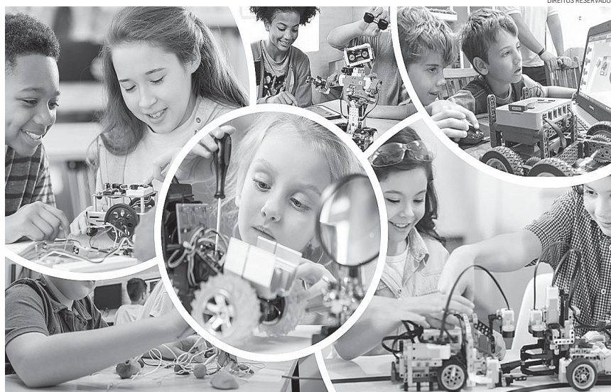
O projeto pretende "alavancar competências computacionais e digitais de crianças e professores", explica a autora.

É no contexto desta mudança que surge o projeto PeCOT - Pensamento Computacional com Objetos Tangíveis, que levará a robótica educativa a escolas do 1.º Ciclo do Ensino Básico. Desenvolvido por um grupo de investigadores das Faculdades de Ciências Sociais e Humanas e de Ciências e Tecnologia da UAc, em parceria com a Escola Básica Integrada de Rabo de Peixe, o NIDeS (Núcleo de Investigação e Desenvolvimento em e-Saúde), o NICA (Núcleo Interdisciplinar da Criança e do Adolescente), o LIACC (Laboratório de Inteligência Artificial e Ciência de Computadores) e o Departa-