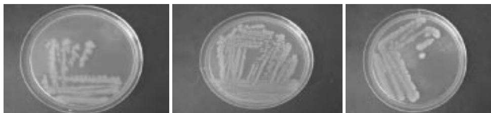
Figura 4 - Isolados Bacillus de amostras da Ilha do Pico em caixas de Petri com meio UG agarizado.