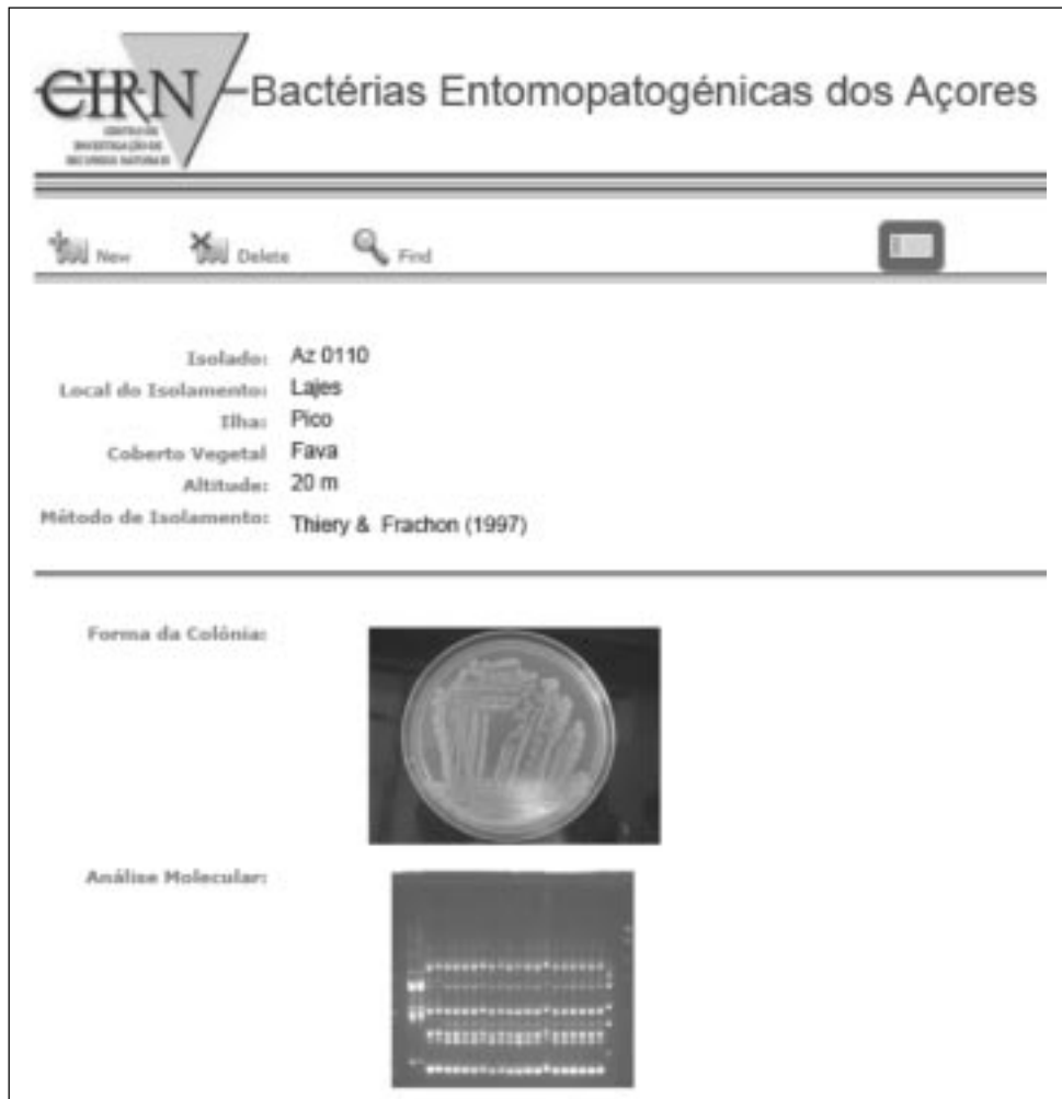
Figura 3 - Folha de registo da base de dados “Bactérias Entomopatogénicas dos Açores” do CIRN.