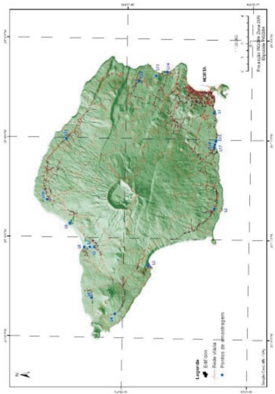
Figura 2 - Localiza o das amostras recolhidas na Ilha do Faial.