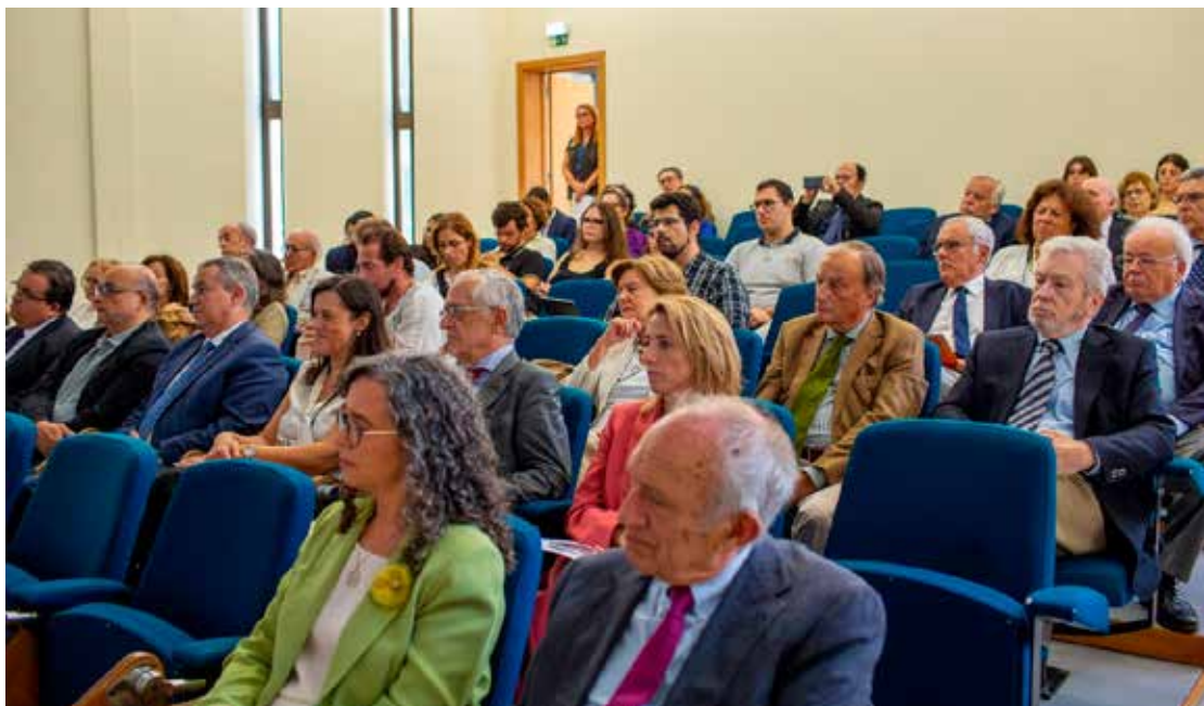
Participantes no Colóquio em Ponta Delgada, 10 de Outubro de 2024.