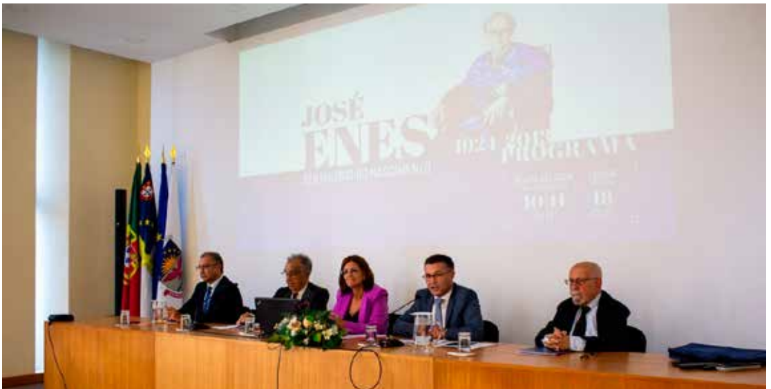
Sessão de abertura. Da esquerda para a direita: Presidente do Governo dos Açores, Representante da República para a Região Autónoma dos Açores, Reitora da Universidade dos Açores, Presidente da Assembleia Legislativa da Região Autónoma dos Açores, Presidente do Instituto de Filosofia Luso-Brasileira.