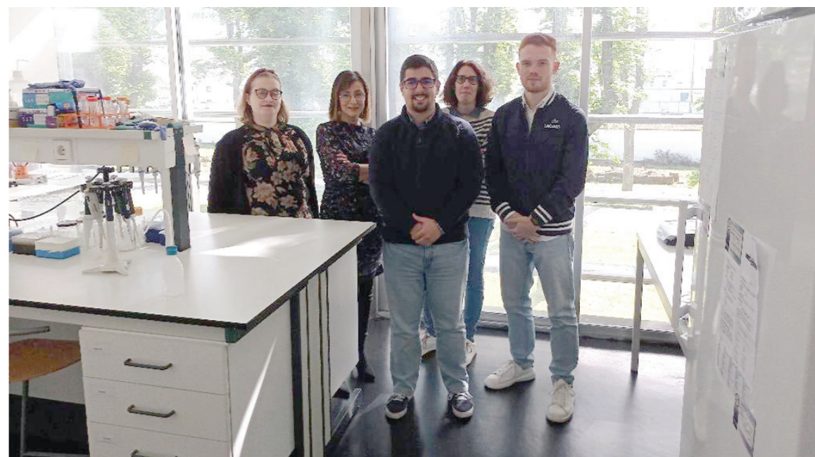
Alunos do 2º e 3º ano de Medicina participam, na Universidade dos Açores, em projetos de investigação acerca de doenças raras.

no entanto, que os progressos científicos se têm acelerado nos últimos anos, trazendo a expectativa de que ofertas terapêuticas sejam disponibilizadas a um ritmo mais acelerado, para benefício de doentes e famílias. É nestes dois pilares – o diagnóstico e o tratamento – que as universidades/centros de investigação têm vindo a desempenhar um papel fundamental e que se advinha ainda mais promissor nos próximos anos, dado não só terem o conhecimento científico como também uma ligação aos doentes, através do seu vínculo a hospitais universitários ou através da organização de equipas de investigação multidisciplinares, das quais fazem parte profissionais de saúde. A ligação entre as universidades e as instituições prestadoras de cuidados de saúde, bem como com