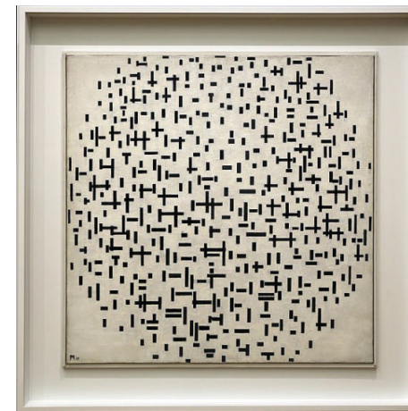
Composição de Piet Mondrian

na ideia, passar cartão a, perceber peva, perceber puto, e pregar olho.