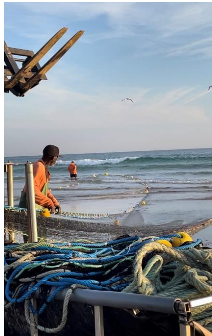
Figura 5 – Boias

Importa destacar que essas artes, sobretudo as redes, demandavam um processo subsequente de secagem ao sol, mediante suspensão em varas, com o intuito de eliminar