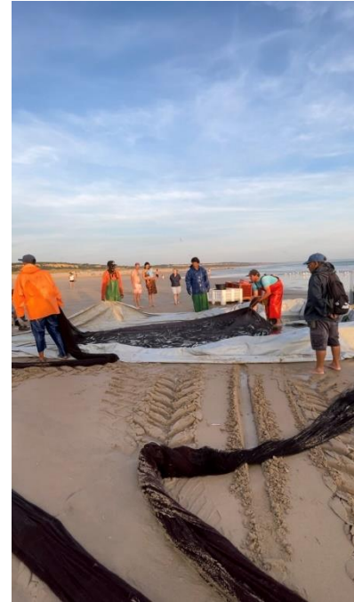
Figura 11 – Abertura do saco Fotografia da autora, 2023

Este processo compreende a alocação do pescado destinado à venda na lota, à comercialização direta na praia e, ainda, a segregação do pescado considerado não comercializável, o qual engloba peixes sem valor comercial ou que tenham sofrido danos durante a captura. 201 Por outras palavras, neste momento, o responsável pelo manuseio da rede realiza um corte vertical na própria rede, dando início à etapa de seleção dos peixes capturados. Essa tarefa envolve a participação de todos os membros da companhia. Os pescadores formam um círculo amplo ao redor da pilha de peixes, começando a separar aqueles que estão nas extremidades. À medida que o processo avança, o círculo fecha-se gradualmente e os pescadores aproximam-se do centro do saco de pesca. Em algumas situações, a companhia divide-se em dois grupos: um grupo permanece sobre o saco de pesca, realizando a separação manual dos peixes, enquanto o outro grupo posiciona-se ao redor das dornas – para ir enchendo cada uma com o