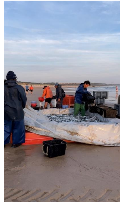
Figura 3 – Companha a armazenar o peixe

As companhas são grupos de pescadores que se organizam sob a chefia de um líder e a sua estrutura não se limita apenas aos companheiros de trabalho, incluindo também a embarcação, o motor, as redes, as cordas, três ou mais tratores, recipientes para transportar o peixe, um reboque acoplado a um dos tratores para o transporte de várias cargas e um barracão/armazém destinado ao armazenamento de todos estes elementos. 131 As companhas surgiram como resultado do desenvolvimento da pesca artesanal e eram, essencialmente, sociedades ligadas a uma rede ou embarcação, sob orientação de um líder/arraís que, efetivamente teria maior poder económico. 132