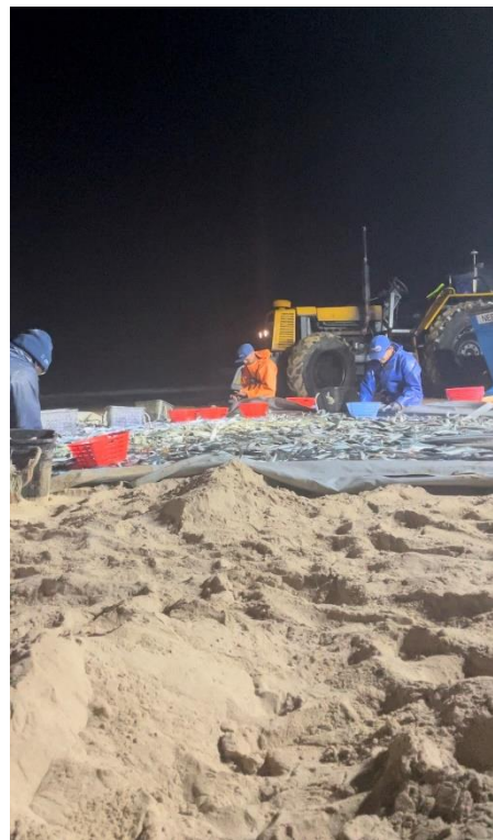
Figura 4 – Seleção do peixe (abundância de espécies)

Embora seja comum entre os pescadores e investigadores referir-se à Arte-Xávega como arrasto, é importante frisar que esta prática não partilha qualquer semelhança com os arrastos modernos realizados por embarcações de grande porte na pesca industrial. Nesta última abordagem, a captura indiscriminada de várias espécies de peixe