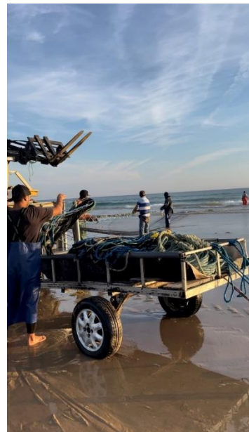
Figura 8 – Atrelado para armazenar as cordas

Inicialmente, os tratores encontram-se entre 200 e 300 metros um do outro. Conforme as cordas alcançam a praia, os operadores dos tratores trocam sinais para assegurar que as cordas permaneçam paralelas, com base no número de cordas desenroladas e recolhidas. O arraiz de terra fornece instruções para que os tratores se aproximem e estreitem o cerco. À medida que a corda da banda panda é recolhida, um dos pescadores agrupa-a em feixes compostos por quatro cordas, que são amarrados e empilhados no trator. Simultaneamente, a corda da banda barca é recolhida e enrolada no interior da embarcação.