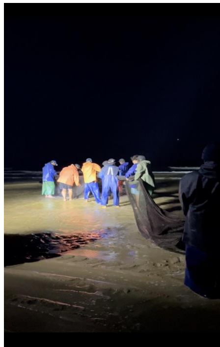
Figura 21 – Companhia a puxar a rede cheia

Percebemos, assim, que a estrutura da rede ou Arte-Xávega é bastante complexa, sendo constituída por três elementos essenciais: os Alares, a Boca e o Saco. Os Alares são compostos por panos de rede com malhas distintas, cada um equipado com cordas contendo boias e chumbos para manter a estrutura aberta na água, formando uma espécie de barreira. A Boca da Arte é constituída por seis panos, sendo o superior equipado com boias, o inferior com chumbos e dois panos laterais chamados Costaneiros, onde os Alares são fixados. O Saco é composto por panos com malhas progressivamente menores, culminando na