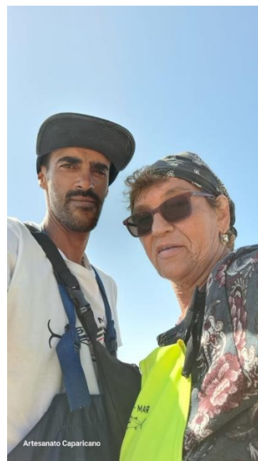
Figura 23 – Elemento feminino da Companhia Poseidon

Nota-se, portanto, um crescente destaque para o papel desempenhado pelas mulheres nas comunidades pesqueiras, em relação às mudanças que têm