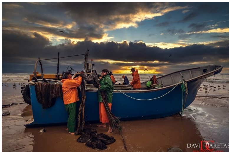
Figura 15 – Barco de Arte-Xávega recente da Companhia Poseidon

O inicial agrupamento de pescadores e, posteriormente, as suas famílias, expandiu-se ao longo do tempo, da Costa da Caparica, para incluir a Cova do Vapor e a Fonte da Telha, enfatizando, até meados do século XX, a importância económica da atividade piscatória, preponderantemente de índole familiar. 251