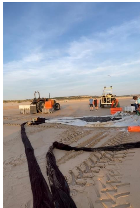
Figura 6 – Dornas : Caixas para armazenar o peixe

Em terra, trabalha um número variável de 15 a 20 indivíduos, de ambos os géneros,