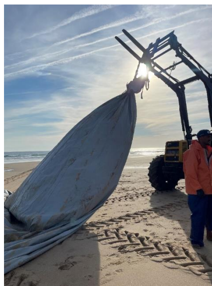
Figura 20 – Oleado Fotografia da autora, 2023