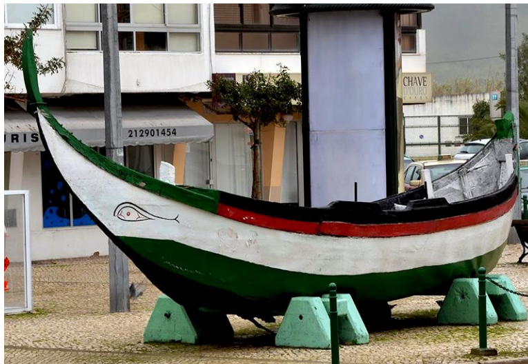
Figura 13- Saveiro ou Barco de Mar

Na Caparica, a Arte-Xávega teve início com o uso de embarcações designadas por Saveiros ou Barcos de Mar, introduzidos pelos pescadores da Beira Litoral. Apresentavam proa e popa elevadas, concebidas para vencer as ondas na saída e no regresso à praia.