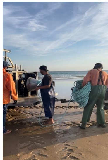
Figura 18 – Alar da rede Fotografia da autora, 2023

No desfecho do processo de lançamento da corda da banda panda, a embarcação reduz a sua velocidade e passa a navegar em paralelo à linha de costa. Durante este momento, é atirado ao mar o