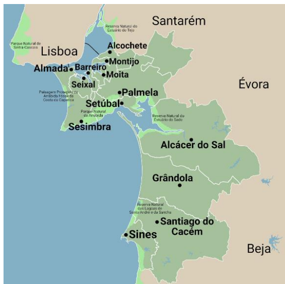
Figura 1 – Mapa de Setúbal e região

Em Portugal, a pesca desempenha um papel fundamental como atividade marítima, tanto do ponto de vista social como do ponto de vista económico, uma vez que o território é banhado pelo Oceano Atlântico e possui uma extensa costa marítima. Assim, a pesca é essencial