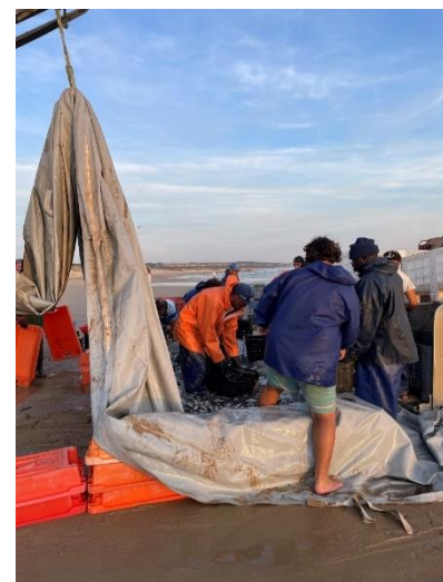
Figura 12 – Seleção do peixe