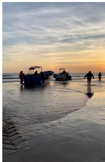
Figura 17 – Entrada no mar

Conforme explicitado no capítulo 2, o processo de pesca associado à Arte-Xávega compreende várias fases, sendo a central o chamado lanço . Detalhadamente documentada 260 na região da Costa da Caparica e Fonte da Telha, pode ser sumariada nas seguintes etapas: a entrada ao mar da embarcação, atualmente facilitada por um trator e, depois, com a utilização do seu motor para superar a linha de rebentação na praia, a extremidade da corda da banda panda é amarrada a um dos tratores - cada trator tem a sua função atribuída (por exemplo, um dos tratores encarrega-