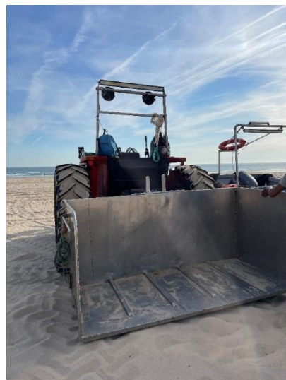
Figura 2 – Trator da Companhia Poseidon Fotografia da autora, 2023

Neste processo evolutivo, devemos compreender as implicações das adaptações técnicas ao nível da mão-de-obra requerida. Inicialmente, o método manual de alagem da arte