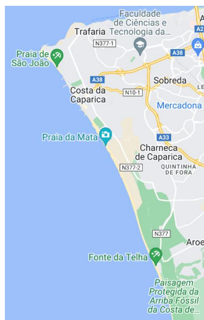
Figura 16 – Mapa da Costa da Caparica

No que concerne à habitação dos pescadores, destaca-se a importância crucial da proximidade ao mar para a viabilidade da atividade pesqueira. A decisão de embarcar na faina está intrinsecamente ligada à observação das condições do mar, conferindo à proximidade da habitação à praia um papel determinante nas escolhas dos mestres e na eficácia de convocar os companheiros para a pesca. Tradicionalmente, um membro da companhia, frequentemente uma criança, desempenhava a função de chamador , percorrendo as habitações dos pescadores e convocando-os para a faina com o chamamento chama o arrais .