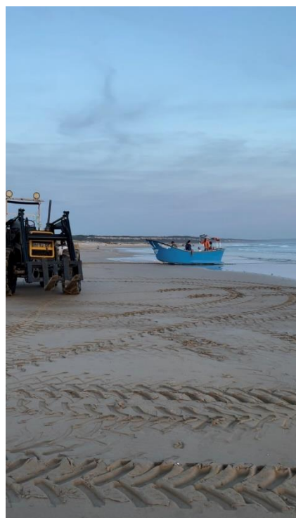
Figura 22 – Barco Poseidon Fotografia da autora, 2023

A sua proa é alta, redonda e projetada para a frente, contrastando com uma popa apainelada, equipada com dois patins e degraus que facilitam o acesso após o lançamento na água. Originária de Sesimbra, a embarcação está equipada com um motor embutido de 100 cv, cujas