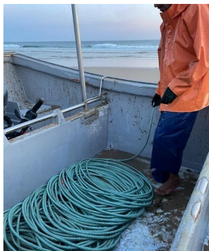
Figura 19 – Armazenamento da corda da banda barca Fotografia da autora, 2023

As espécies mais comumente capturadas na Costa de Caparica incluem a cavala, o carapau, a sardinha e o sargo-do-Senegal. 270 Atualmente, a atividade piscatória concentra-se na captura de cavala, uma vez que esta espécie proporciona um retorno financeiro mais substancial. 271