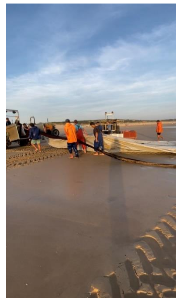
Figura 10 – Saco a ser arrastado por cima do oleado pelo trator

O retorno das embarcações do mar para terra representa um momento de alto risco. Devido à rebentação das ondas na beira-mar. Durante esse processo, existe a possibilidade da embarcação encalhar na areia e capotar. Para mitigar esse risco, ao chegar à costa, a tripulação amarra uma corda à embarcação e utiliza tratores para auxiliar na tração. Os tratores são conectados à argola da proa e da lateral dianteira do barco, puxando-o para a terra. Simultaneamente, um membro da tripulação remove a água acumulada no interior da embarcação, enquanto os outros membros participam dos