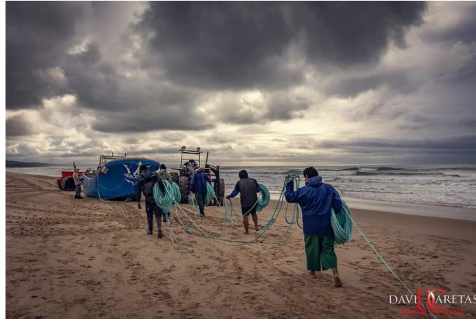
Figura 9 – Mudança da banca barca para a banda panda

causem danos à rede. Os dispositivos da banda barca são desembarçados e armazenados na embarcação, seguindo-se a instalação da gacheta e dos dispositivos da banda panda, com o desfecho dos nós que fixavam os rolos das cordas. 196