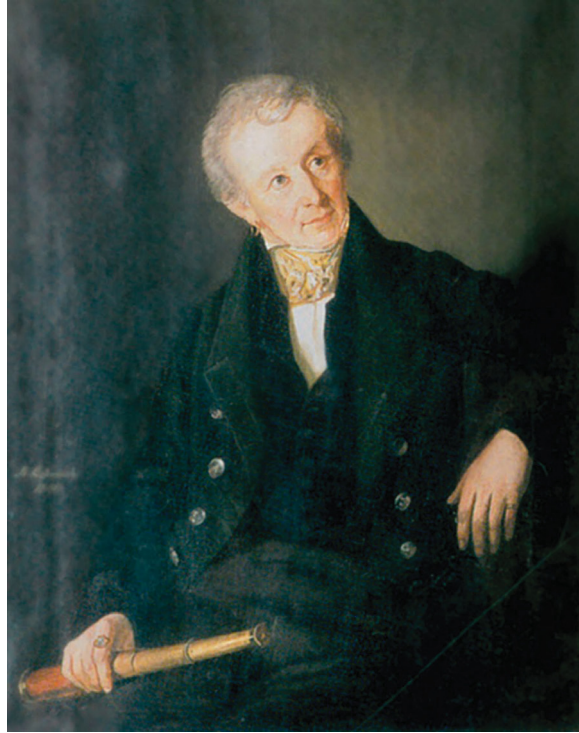
Fig. 2 - O cientista Vargas-Bedemar, numa pintura de 1840, do Museu Geológico de M. Brännich 32 .

É uma das [ilhas] pequenas e das mais notáveis do Arquipélago dos Açores. Quase no centro dela é que se acha o xisto argiloso primitivo, em camadas horizontais estendidas; a estas camadas se acham sobrepostas rochas basálticas e traquíticas. Na ponta meridional acha-se uma vasta cratera, no fundo da qual saem, por uma fenda quase inacessível, muitas florescências de enxofre. Uma veia basáltica mui notável desce por uma das paredes interiores da cratera de lava traquítica. O espaço em forma de anfiteatro semicircular, onde se acham colocadas três capelas nos três pontos principais, junto a Santa Cruz, não é mais do que um seguimento da cratera 33 .