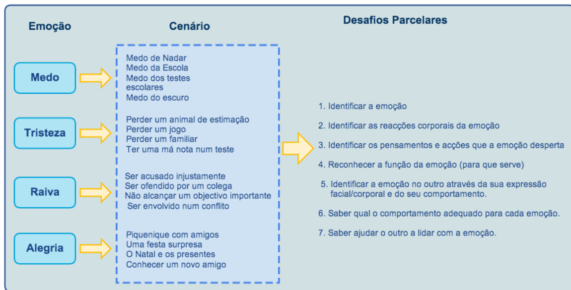
Figura 3- Diagrama da estrutura dos capítulos e cenários já pensados para o jogo.