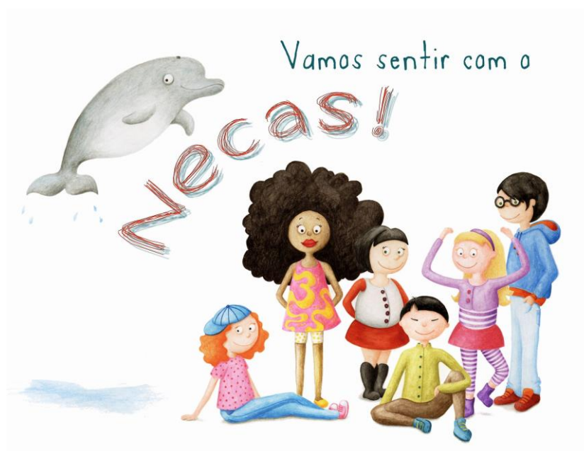
Figura 2 – Imagem do conjunto das personagens

Com a exceção do Necas, todas as restantes personagens da série são jogáveis, permitindo experiências de jogos diferentes e promovendo, entre muitos outros aspetos, a igualdade de género no que diz respeito à utilização de software educativo (Alvarez, 2005).