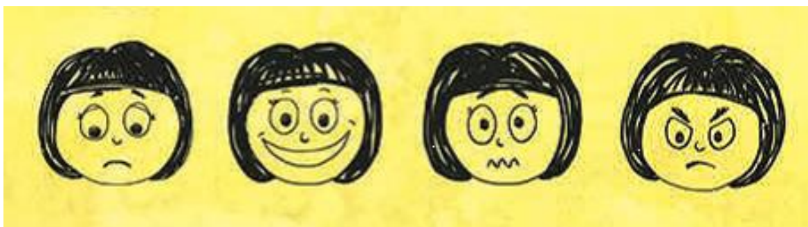
Figura 5- Expressões faciais das emoções retratadas no jogo. (da esquerda para a direita: tristeza, alegria, medo e raiva)

Através do processo de Facial Rigging , as animações das expressões faciais das personagens estão a ser trabalhadas de acordo com as ilustrações originais (Figura 5).