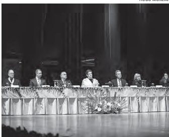
UAc celebra 44.º aniversário.