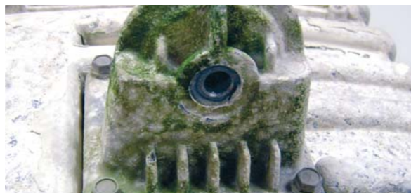
Fig-1 - Corrosão em plataforma Canopy (Ilha das Flores).

agravados por uma atmosfera húmida, contendo também compostos de enxofre, provenientes do ambiente vulcânico e geotérmico inerente à região. Os compostos de enxofre (SO 2 ) acidificam a água (eletrólito na corrosão eletroquímica) e aceleram a corrosão, encurtando os tempos de vida dos equipamentos (Fig.1). Nas atmosferas marinhas a presença de cloretos é o fator determinante no aparecimento e avanço da corrosão.