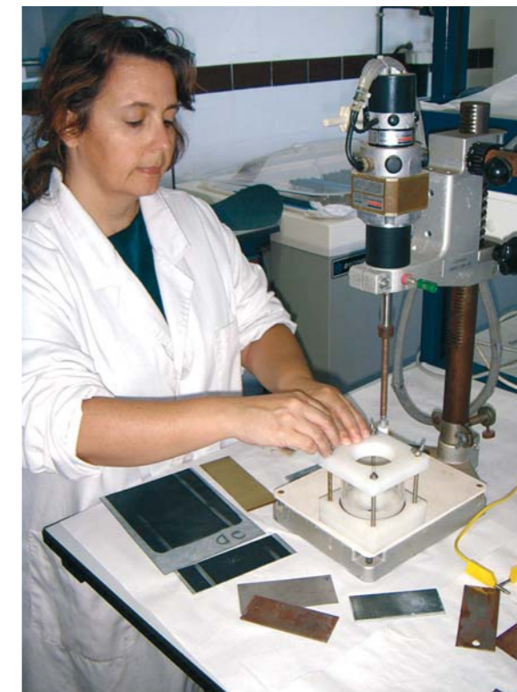
Fig-3 - Preparação de provetes metálicos para análises de corrosão

pos central e ocidental e chuvoso no grupo oriental; _ quanto à humidade do ar: húmido;