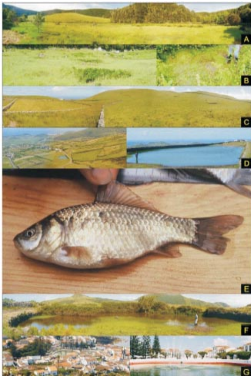
Prancheta I. Zonas húmidas da ilha Graciosa: Lagoa da Caldeira (A); poças do Fundão da Caldeira (B); Lagoa da Serra Branca (C); Charco do Tanque (D), e exemplar de Carassius auratus aí capturado (E); Charco do Barreiro (F); Pauls de Santa Cruz (G).