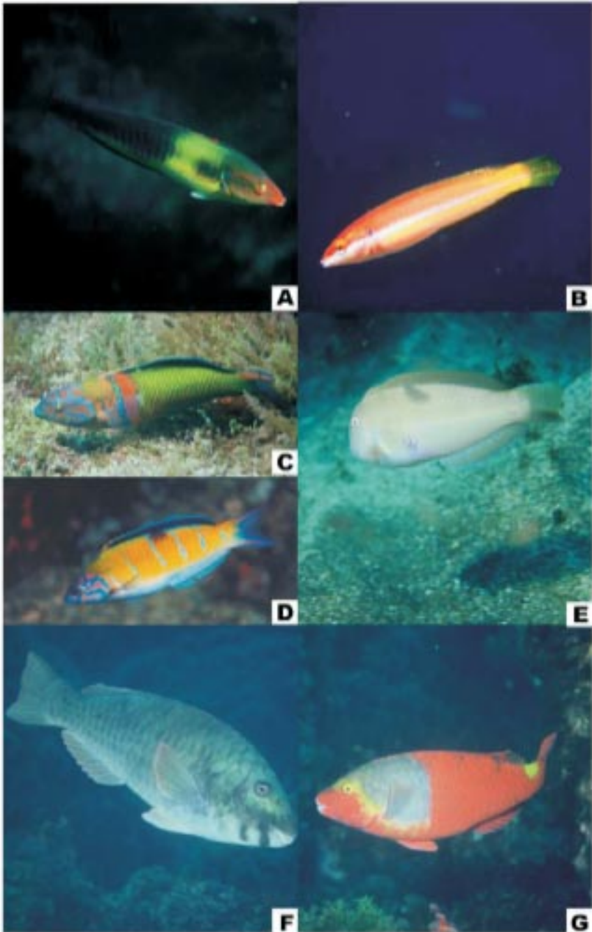
Prancheta IV. Peixes marinhos da Graciosa: peixe-rei, Coris julis (macho, A, e fêmea, B); rainha, Thalassoma pavo (macho, C, e fêmea, D); bodião da areia, Xyrichtys novacula (E); veja, Sparisoma cretense (macho, F, e fêmea, G).