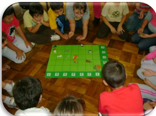
Fotografia V - Exploração do jogo