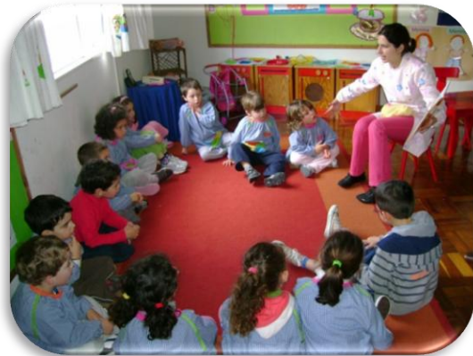
Fotografia IV – Leitura da história “O Ciclo do Mel”