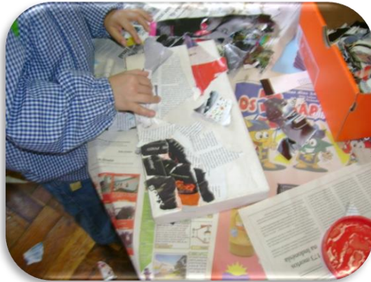
Fotografia III – Actividade da elaboração de arquivos com caixas de sapatos