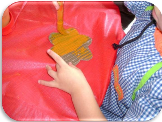
Fotografia I – Actividade com o material de cartão em formato de joaninhas e flores