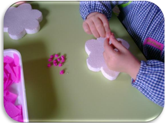
Fotografia II – Actividade com as flores de esferovite