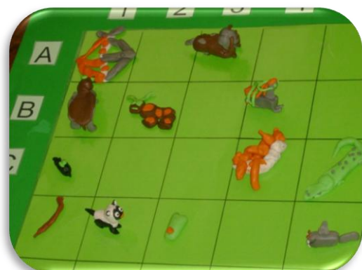
Fotografia VI - Exploração do jogo