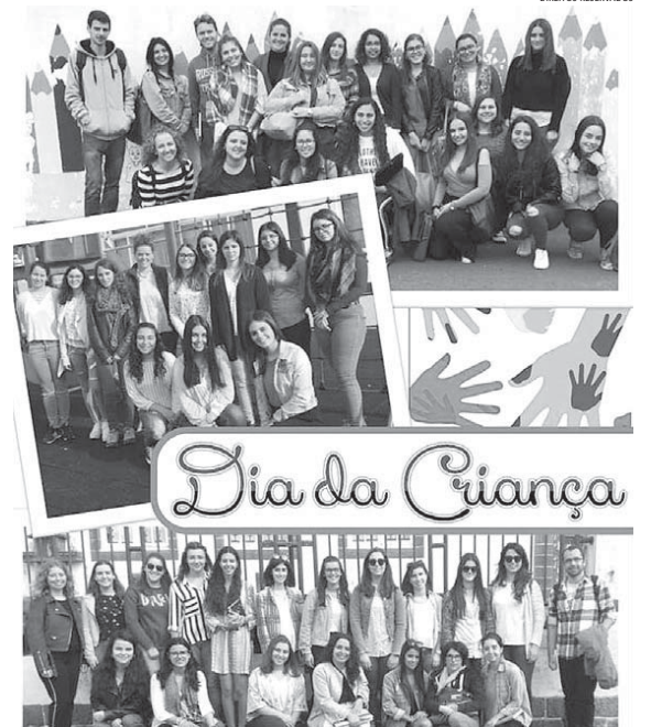
Estudantes de Psicologia e Educação Básica comemoram o Dia Mundial da Criança na presença dos mais pequenos...