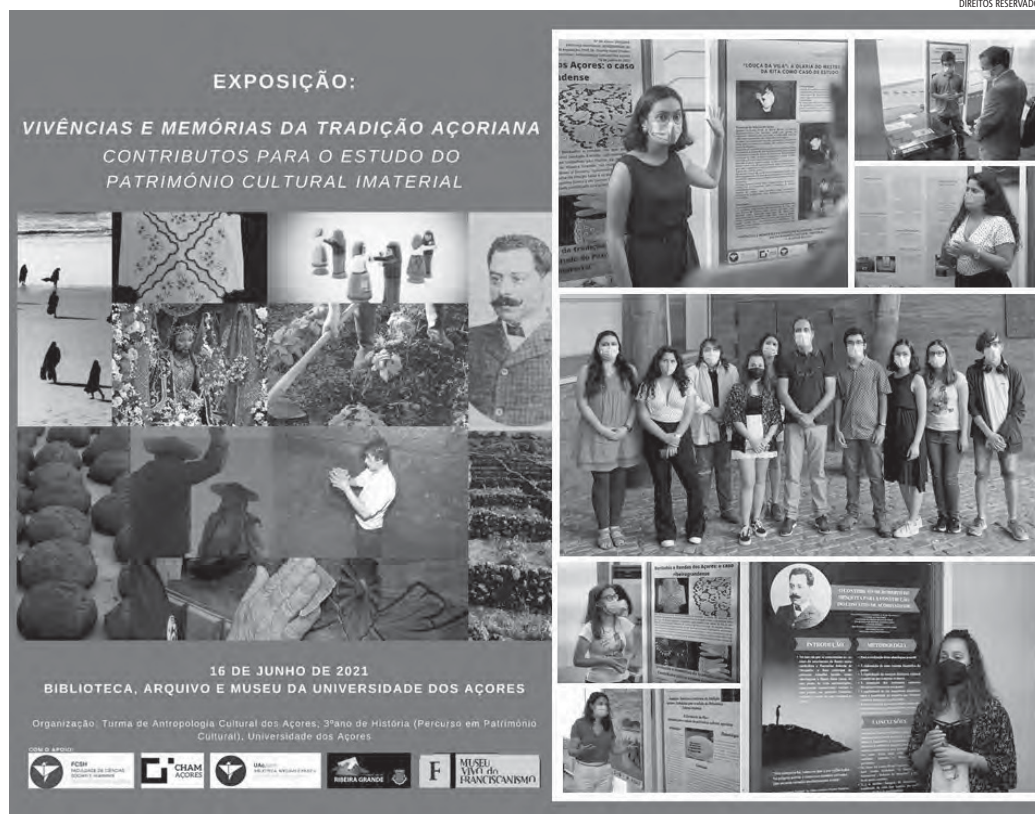
A exposição foi inaugurada a 16 de junho e pode ser visitada até outubro.