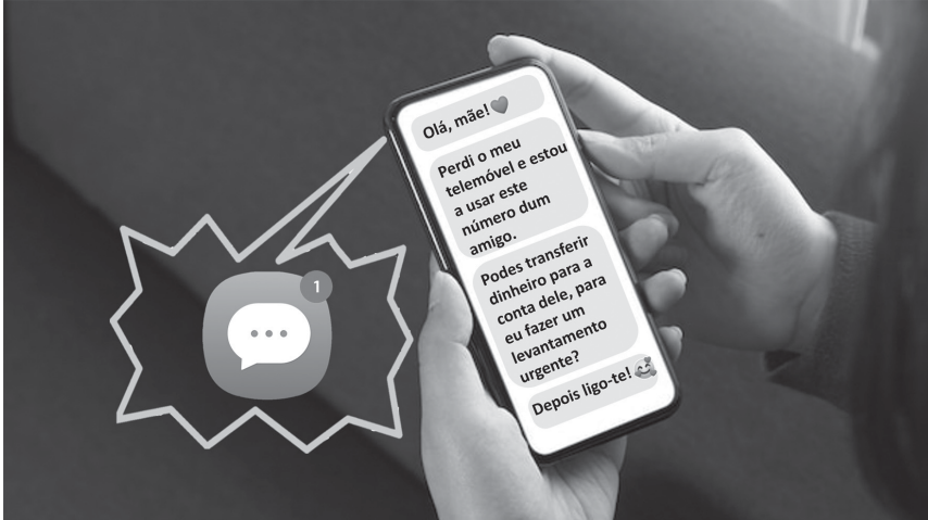
ILUSTRAÇÃO DE ADOLFO FIALHO

“Assim começa a experiência pós-moderna de ter filhos por 10 minutos”.