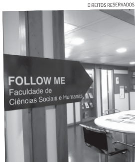
UAc recebe visita da APTRAD