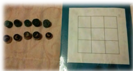
Figura 7 - Jogo do galo.

Descrição: Este jogo é semelhante ao jogo do galo tradicional. O tabuleiro é uma tabela de três linhas por três colunas. Dois jogadores escolhem uma marcação cada um, uma lua ou um céu azul claro. Os jogadores jogam, uma marcação por vez, numa casa que esteja vazia. Ganha quem conseguir marcar três quadrados em linha, quer na horizontal, na vertical ou na diagonal. Sempre que possível, o jogador deve impedir o adversário de ganhar na próxima jogada.