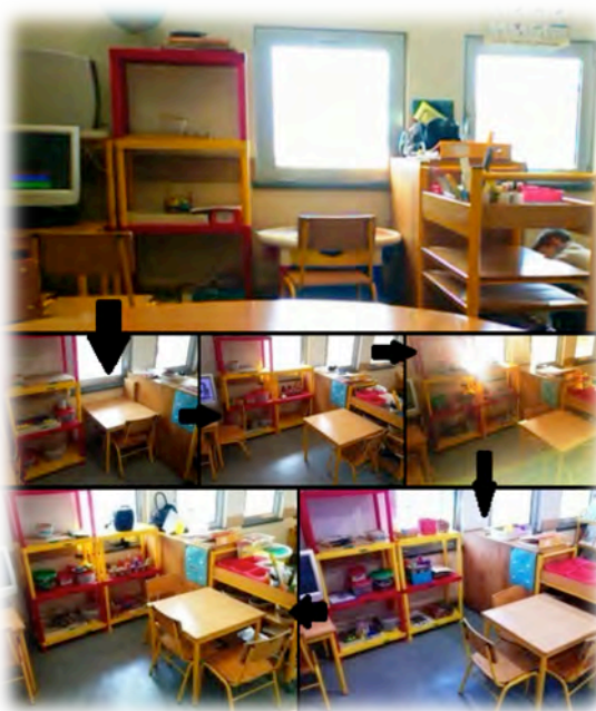
Figura 16 - Evolução da área da Matemática.

Por outro lado, a figura 16 mostra a evolução da área da Matemática, onde foram colocados todos os jogos que já existiam no âmbito da Matemática, bem como todas as atividades e jogos implementados na sala de atividades pela estagiária.