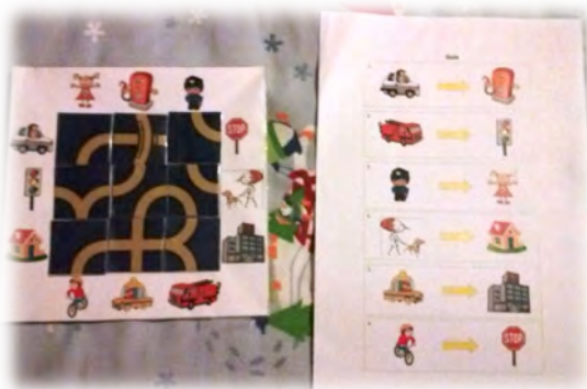
Figura 4 - Jogo dos meios de transporte terrestres .

Descrição: Este jogo continha um guia com 6 desafios, um tabuleiro com 12 pontos de partida/chegada e 9 peças que permitiam a construção de diferentes trajetos entre os pontos de partida e os de chegada. Para ganhar o jogo, a(s) criança(s) deveria(m) consultar o guia com as indicações dos pontos de partida e de chegada, para construírem, com as peças, um trajeto viável entre os mesmos.