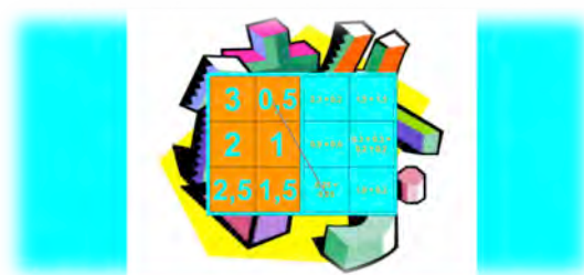
Figura 12 - Desafio do jogo da unidade .

O que foi feito: Dos aspetos observados, aquando da implementação destes jogos, apontámos os seguintes: