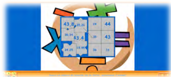
Figura 11 - Desafio do jogo dos arredondamentos .