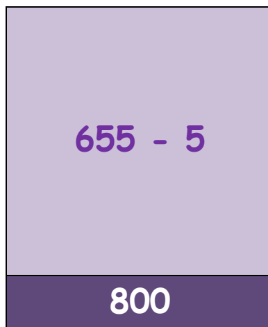
Figura 14 - Exemplo de uma carta do jogo da pesca dos números .

O que foi feito : No tempo letivo de Matemática, em que duas alunas que estavam ao nível do 2º ano não tinham tido apoio fora da sala de aula, criámos um jogo de cartas, adaptado aos conteúdos do currículo de Matemática delas. Da implementação deste jogo, destacámos os seguintes aspetos: