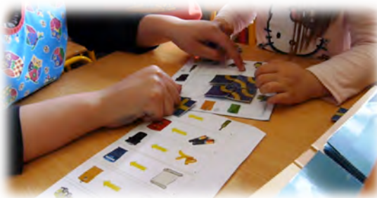
Figura 1 - Jogo da reciclagem (adaptado do jogo Gato & Rato – SmartGames ).

Descrição: Este jogo continha um guia com 6 desafios, um tabuleiro com 12 pontos de partida/chegada e 9 peças que permitiam a construção de diferentes trajetos entre os pontos de partida e os de chegada. Para ganhar o jogo, a(s) criança(s) deveria(m) consultar o guia com as indicações dos pontos de partida e de chegada, para construírem, com as peças, um trajeto viável entre os mesmos.