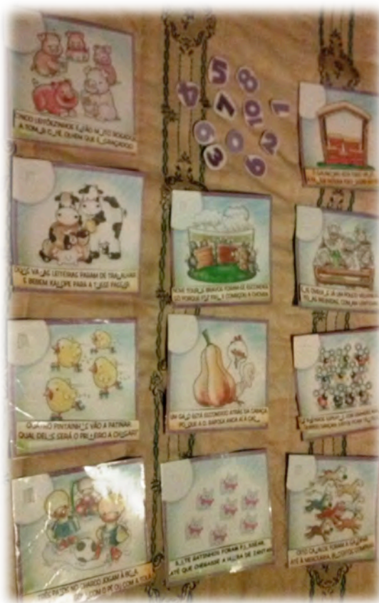
Figura 5 - Material de jogo dos números da primavera.

O que foi feito: No final desta atividade, destacámos que: