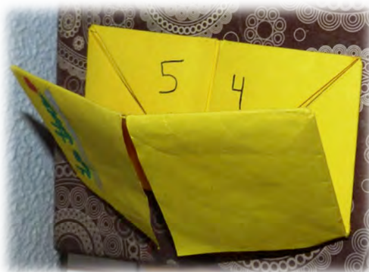
Figura 13 - Quantos queres da Matemática elaborado por uma aluna.

correspondente ao número escolhido, para que o colega tente responder corretamente. Se o colega não o conseguir fazer, tem direito a que quem segura o origami o ajude, escrevendo algumas dicas e/ou passos no quadro branco. Se houver mais do que dois jogadores e a resposta de quem escolheu o número não estiver correta, outro jogador tentará responder acertadamente, primeiro, sem a ajuda de quem segura o jogo.