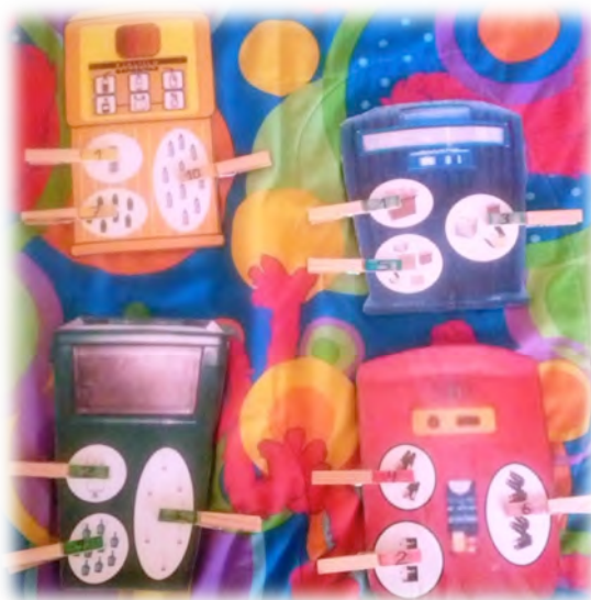
Figura 3 - Jogo dos ecopontos .

O que foi feito: No jogo dos ecopontos , as crianças tinham que prender molas de roupa com números, em 4 cartões, com as formas e cores dos diferentes ecopontos, que incluíam 3 grupos com um determinado número de itens. A pensar nos diferentes níveis de desenvolvimento das crianças da sala de atividades, colorimos as molas de acordo com a cor de cada cartão para onde deveriam ir. No entanto, para que cada cartão fosse preenchido corretamente as três molas numeradas, correspondentes a cada cartão, teriam que ser presas no grupo de elementos correto. Por exemplo, a mola com o número 3 teria que ser presa no cartão que tivesse um grupo com 3 itens. As crianças tinham tendência a fazer corresponder apenas as cores, pelo que fomos ajudando as que exibiam mais dificuldades, a contar o número de elementos dos grupos, para que depois elas prendessem a mola no grupo correto. Com a aplicação deste jogo, destacámos os seguintes aspetos: