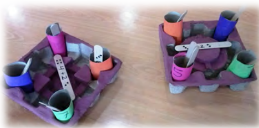
Figura 6 - Jogo dos vasos da primavera .

Descrição: Cada criança ou grupo recebia um tabuleiro com tubos numerados de 4 a 7 e o conjunto de paus que lhes correspondia. De seguida, ia-se efetuando as adições que figuravam em cada pau e colocavam-se os paus no tubo com o numeral correspondente. Ganhava a criança ou o grupo que distribuísse corretamente os paus pelos diferentes tubos, em primeiro lugar.