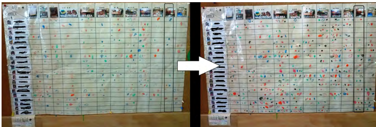
Figura 15 - Ocupação das áreas pelas crianças da Educação Pré-Escolar.

Através da análise da figura 15, podemos constatar que, nas duas últimas semanas de estágio, houve um acréscimo na adesão à área da Matemática, bem como no número de crianças que aderiram à mesma. Enquanto que na penúltima semana de intervenção aquela área foi frequentada 9 vezes, na última, essa frequência aumentou para 20. Por outro lado, enquanto que na penúltima semana 8 crianças frequentaram a área da Matemática, na última, esse número aumentou para 14.