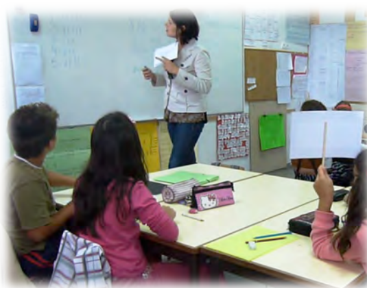
Figura 9 - Concurso dos números até 100 000.

Descrição: Para jogar este jogo, um dos participantes segurava os cartões, enquanto que os restantes organizavam-se em pares, cada par com uma tabuleta. Quem segurava os cartões ia colocando as questões, uma por uma, fazendo-se, através de um cronómetro, a contagem decrescente de um minuto. Os pares iam escrevendo as suas respostas, com canetas de quadro branco, nas respetivas tabuletas. Terminado o minuto, quem conseguisse responder levantava a sua tabuleta. Quem segurava os cartões escrevia a resposta correta no quadro branco e registava um ponto por cada par que tinha respondido acertadamente à questão colocada.