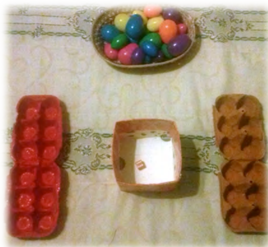
Figura 8 - Jogo dos ovos da páscoa.

Descrição: Este jogo devia ser explorado entre duas equipas ou dois adversários. O primeiro lançava o dado para a caixa e via quantas pintas constavam na face voltada para cima, para retirar o número correspondente de ovos do cesto e colocá-los na sua caixa. Ganhava quem preenchesse a sua caixa primeiro.