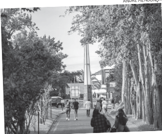
Os novos estudantes serão colocados a partir de 27 de setembro