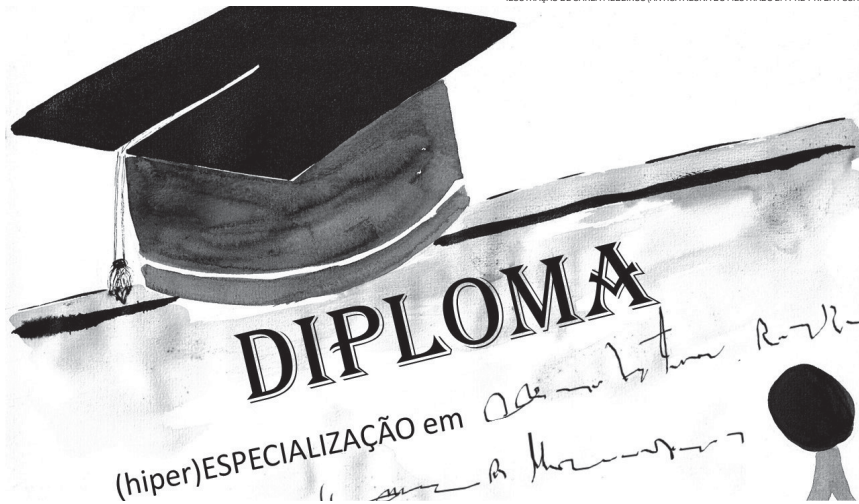
ILUSTRAÇÃO DE CARLA MEDEIROS (ANTIGA ALUNA DO Mestrado em Pré-PRI da FCSH)

“Os professores universitários regridem para a versão obsoleta do faz-tudo”