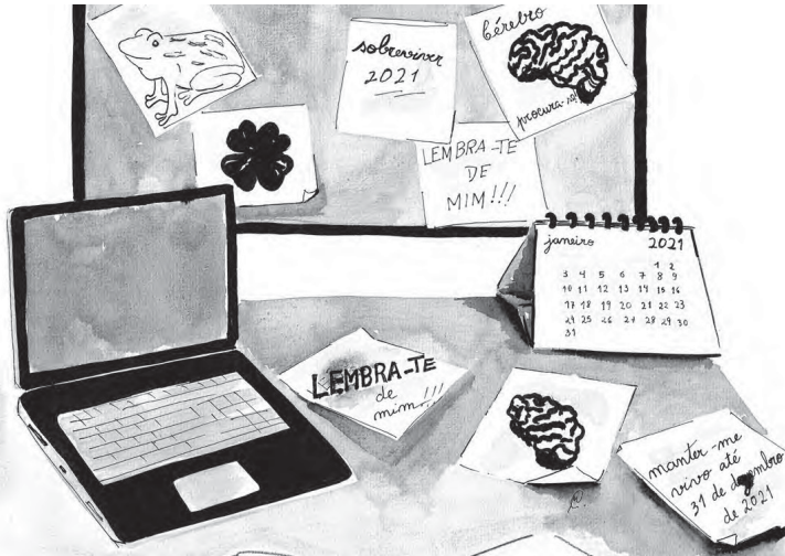
ILUSTRAÇÃO DE CARLA MEDEIROS (ANTIGA ALUNA DO MESTRADO EM PRÉ-PRÍ DA FCSH)

Confira as 5 dicas milagrosas para sobreviver a 2021.