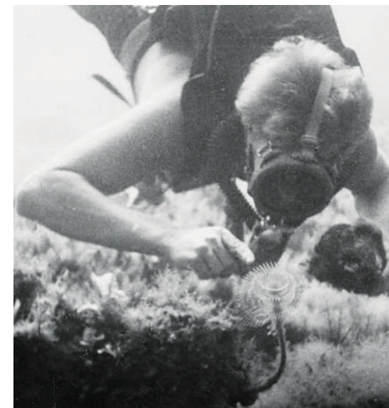
Figura 2. Hans Hass durante a sua expedição de 1942 no Mar Egeu equipado com seu dispositivo de mergulho examina uma sabella (verme tubícola) no fundo do mar (adaptado de Hass, 1954).

A partir do século XIX, cada vez mais cientistas começaram a participar em mergulhos com sinos de mergulho e a realizar as suas próprias investigações. Nesta época, biólogos marinhos e arqueólogos começaram a usar capacetes de mergulho abertos com suprimento de ar conectados por uma bomba no barco. Estes eram sinos de mergulho reduzidos que permitiam ao mergulhador