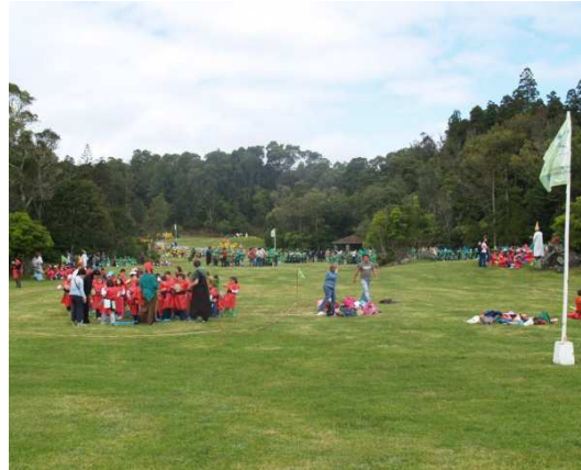
Fig. 4 – Dia Mundial da Floresta 2009