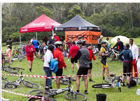
Fig. 2 – Convívio na prova de BTT