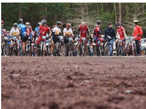
Fig. 1 – Partida de prova BTT

Florestais, actividades de aventura. Tais como, provas de corta-mato, provas de competição de bicicletas de montanhas (Fig. 1 e 2), provas de duatlo, provas de orientação, provas de pentatlo, “ geocaching ”, “ paintballing ”, entre outras actividades. Para além destas atividades também já ocorreu um passeio todo o terreno de jipe (Fig. 3), integrado nas comemorações do Ano Internacional das Florestas, em Março de 2011. O Serviço Florestal de Ponta Delgada tem desenvolvido acções de sensibilização florestal no Centro de Divulgação Florestal do Pinhal da Paz direccionadas para estudantes de várias Escolas, bem como as comemorações do Dia Mundial da Floresta (Fig. 4), a 21 de Março de cada ano. O Festival da Azálea, organizado pelo Grupo de Folclore de Santa Cecília da Fajã de Cima, freguesia onde pertence o Pinhal da Paz, também tem sido ao longo dos anos um forte atractivo das actividades de recreio e lazer organizadas no parque.