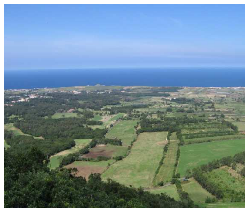
Fig. 6 – Vista em pormenor de parte da Costa Norte da ilha de São Miguel