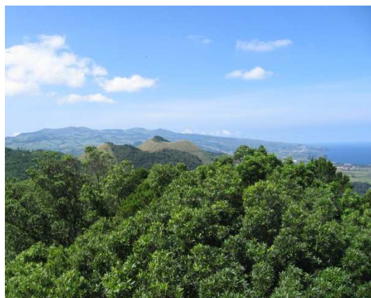
Fig. 5 – Vista geral sobre o “Complexo Vulcânico dos Picos”