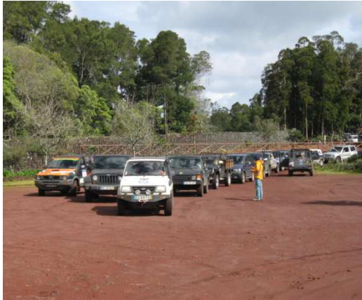
Fig. 3 – Caravana Passeio TT