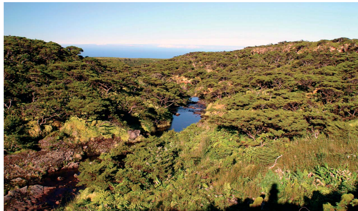
Ribeira da Badanela – Ilha das Flores

tância da protecção e gestão dos ecossistemas aquáticos como um todo, aplicando planos estratégicos e legislação europeia, nomeadamente, a Directiva Quadro da Água (instrumento legal primordial na protecção dos ecossistemas aquáticos europeus - DQA). A DQA têm como principal objectivo a protecção e a gestão dos recursos hídricos ao nível da bacia hidrográfica, abrangendo as componentes hidromorfológicas, físico-químicas e biológicas para as massas de água superficiais, determinando que estas devem possuir, pelo menos um Bom Estado Ecológico em 2015. É neste contexto que surge pela primeira vez o conceito de "estado ecológico" que permite ultrapassar as limitações decorrentes da avaliação da qualidade dos ecossistemas com base unicamente em parâmetros físico-químicos (que apenas nos dão uma imagem isolada no momento da análise). O estado ecológico de um determinado local, deve avaliar em que medida a estrutura biológica e o funcionamento do ecossistema se afasta das situações de referência quando esse local se encontra sujeito a pressões antrópicas. A permanência dos organismos aquáticos nos seus habitats naturais permite que a comunidade amostrada num dado momento reflecta o passado ecológico desse local. Complementarmente, a mobilidade, característica da fauna aquática, permite que organismos amostrados num dado