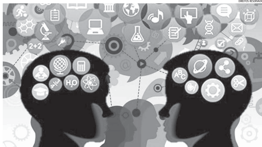
A FCSH e a Licenciatura em Psicologia contam agora com uma sala de estudos em Cognição Humana

A investigação em cognição humana tipicamente faz-se recorrendo a uma amostra de pessoas que voluntariamente participam em experiências cuidadosamente desenhadas. Estas experiências apre-