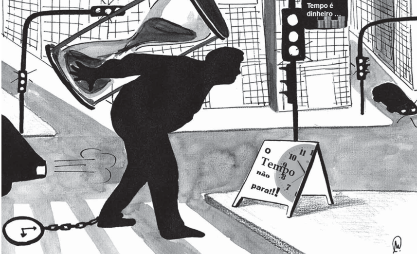
ILUSTRAÇÃO DE CARLA MEDEIROS (ANTIGA ALUNA DO MESTRADO EM PRÉ-PRI DA FCSH)