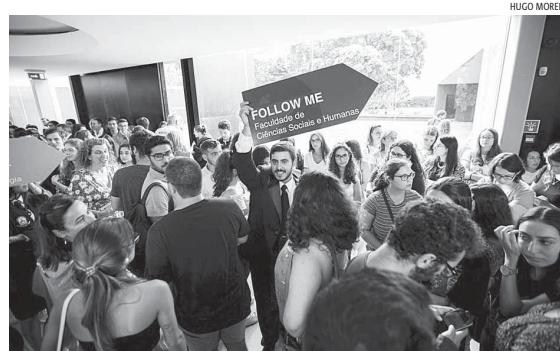
FCSH dá as boas vindas aos novos estudantes

O mês de setembro tem sido ocupado com a receção aos novos alunos da Universidade dos Açores, em matrículas e sessões sobre as plataformas da UAc, regulamentação académica e pesquisa bibliográfica. No dia 16 foi a vez da sessão de acolhimento nas Faculdades. A FCSH recebeu muitos dos 172 alunos que entraram nesta unidade orgânica na 1.ª fase no Concurso Nacional de Acesso (CNA), numa sessão em que foi explicada a estrutura da FCSH e apresentadas as Coordenadoras dos