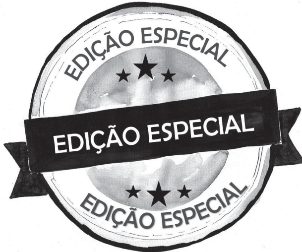
ILUSTRAÇÃO DE CARLA MEDEIROS (ANTIGA ALUNA DO Mestrado em Pré-PRI da FCSH)

"Endireite as costas, limpe as lentes dos óculos e desfrute desta Edição Especial".