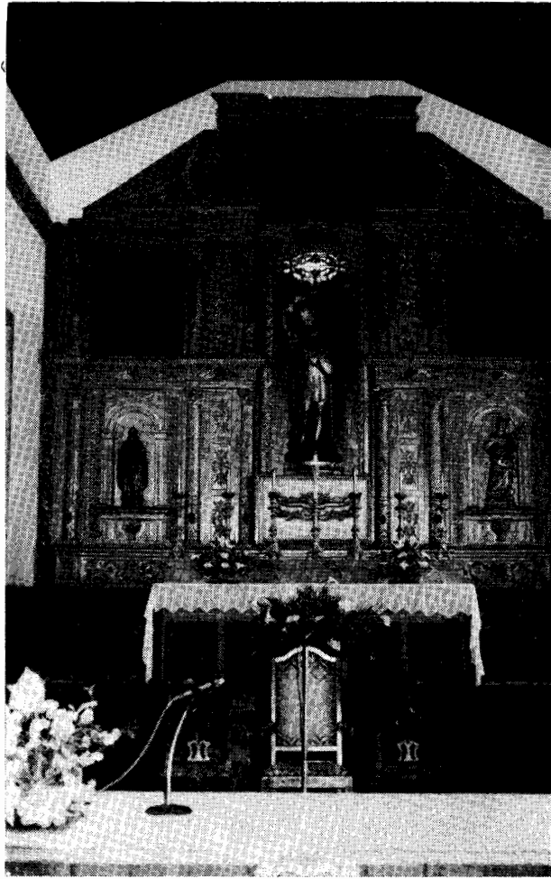
Vila das Velas — S. Jorge (Açores) Igreja Matriz: Retábulo de talha dourada da capela-mor (c. de 1570).