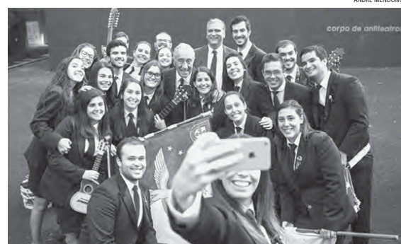
A Selfie da praxe com o Senhor Presidente