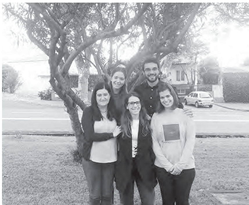
O Projeto Vida + é financiado pelo Governo Regional dos Açores e envolve uma equipa de psicólogos ligados à FCSH

Ao longo dos tempos, a relação entre o ser humano e o consumo de substâncias psicoativas foi-se alterando, e apesar de apenas no Séc. XIX o uso/abuso deste tipo de substâncias ter sido visto como um comportamento patológico, este constitui-se, cada vez mais, como uma preocupação governamental e social. Contrariamente à tendência observada a nível nacional, na Região Autónoma dos Açores (RAA) observou-se um aumento da prevalência dos consumos de todas as substâncias, apresentando a RAA, em 2012, prevalências de 10,6% para os consumos ao longo da vida, enquanto no continente português os valores se situaram nos 9,5% (SICAD, 2016). Para além disso, quando, em 2015, foi aplicado o Inquérito de Comportamentos Aditivos, os resultados demonstraram uma prevalência de 26,6% para estes comportamentos na população da RAA, enquanto a média nacional se situava pelos 23,6% (SICAD, 2016). Os planos de intervenção nacionais e regionais, ao nível dos comportamentos aditivos, apresentam como foco de intervenção privilegiado as relações sociais e os meios envolventes