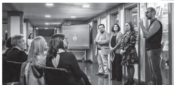
O lançamento do Agora, um marco importante na história da FCSH